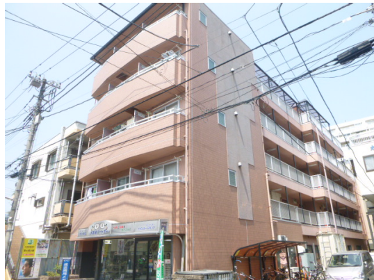
カレッジハイツ 慧 307号室 中央線 西八王子駅徒歩3分